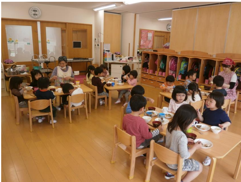
今日 人生初の 上靴とリュック。