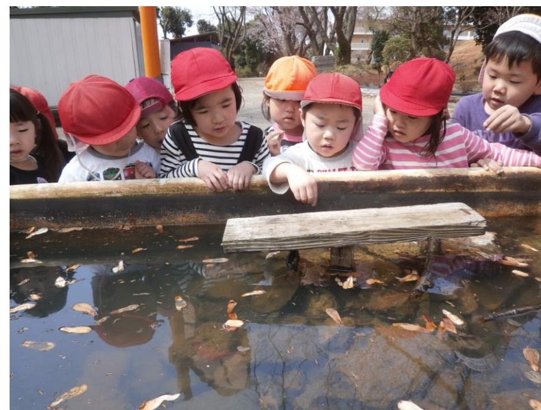
やっと 起きた亀に 「ごはんだよ～」