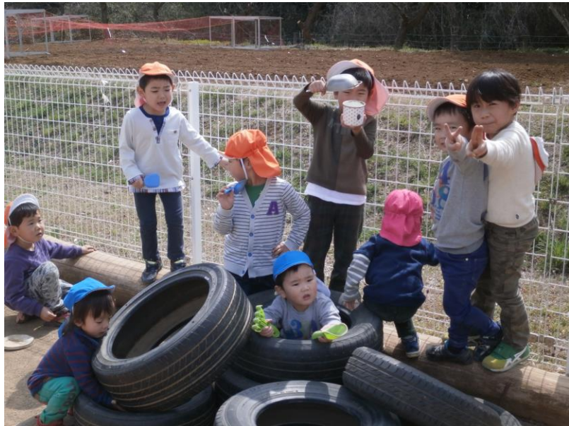
「ここ 撮って」と 基地ごっこの男子。