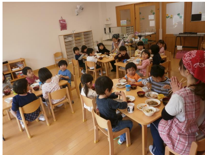
すごく とっても チョー うれしい!ですって。